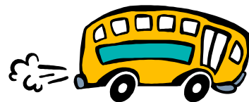
Képhez vagy ábrához tartozó felirat.

A képet kiválasztás után helyezze a cikkhez közel. Ügyeljen arra, hogy a képfelirat a kép mellett legyen.