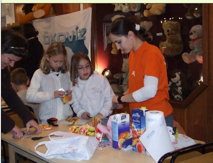
„Hulladékból hasznosat” játszóház