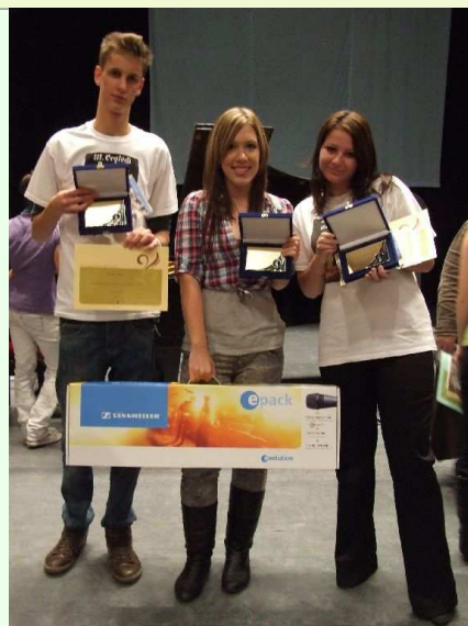
Gigasztár tehetségkutató verseny helyezettei