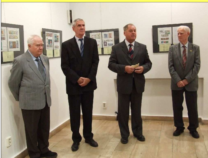
„Sport a bélyegen” c. kiállítás megnyitóján