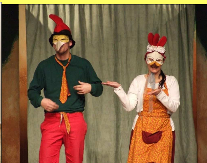
A november 13-i Kukori és Kotkoda gyermekelőadás részlete