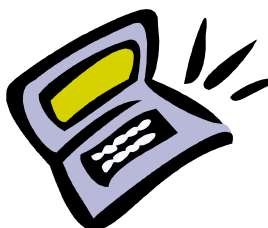
Képhez vagy ábrához tartozó felirat.

A hírlevélhez felhasznált anyagok nagy része a saját webhelybe is beilleszthető. A Microsoft Publisher programban lehetőség van a hírlevél